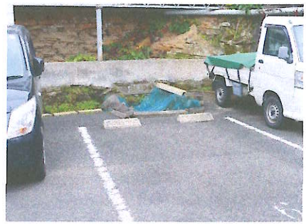
⑨ モンブーシュ大和横駐車場 奥に池があるため注意