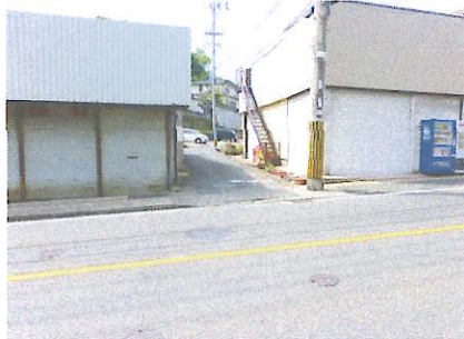
⑪ 人と車の出会い頭に注意