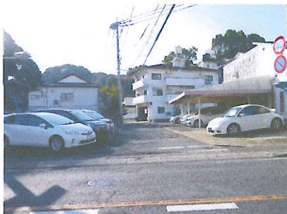
⑤ 原田興産横 夜暗く人通りが少ない 道がせまく車両の通行に注意