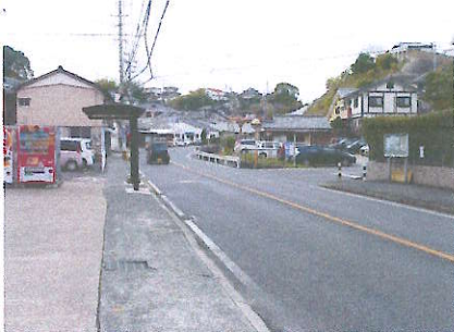
⑩ 横断歩道がなく交通量が多い