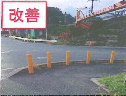
⑦ 歩道がせまく交通量が多い 赤いポールを設置 (R1年)