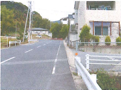
① 春陽台横 路側帯がせまく交通量が多い