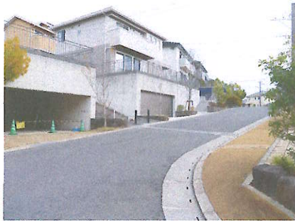
② 大和台入口 横断歩道がない