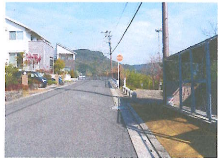
③ 大和台公園前 横断歩道がない