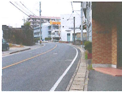
⑧ 林田正年商店前 路側帯がせまく交通量が多い