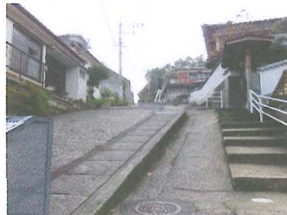
⑭ 坂が急で危険 特に雨天時滑りやすい