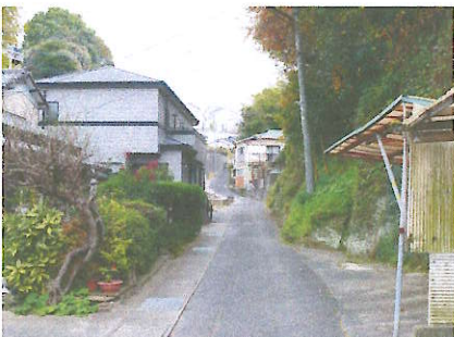
④ 夜暗く人通りが少ない