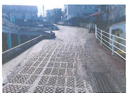
⑮ 西大和公民館に登る坂と駐車場の 間にフェンスがなく危険