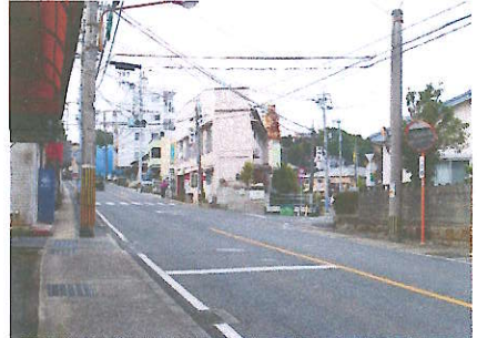
⑫ 車両の通行に注意