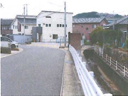
⑬ 大和春陽台公園横 川で遊ぶ子どもがいて危険