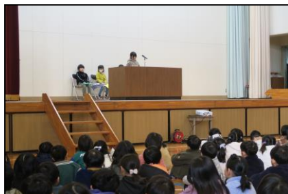
（上手に発表することができた1年生の代表）