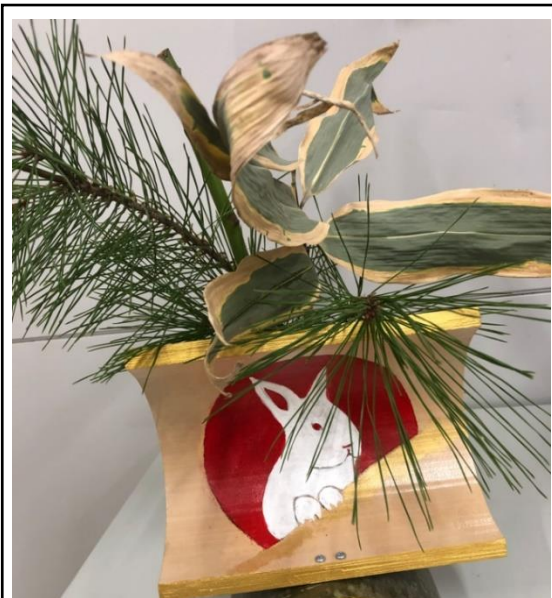
地域の方が作っていただきました。