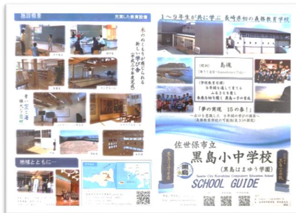
＜義務教育学校周知のチラシ＞