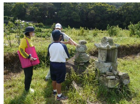
〈ふるさと学習の様子〉