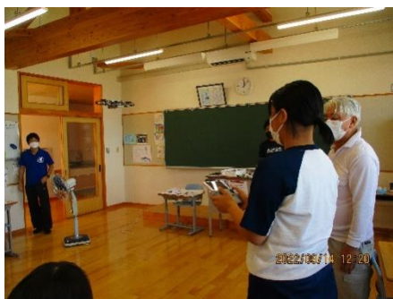
＜ドローン操作の様子＞