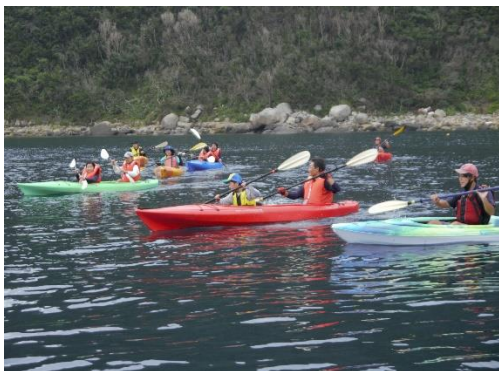
〈シーカヤック活動の様子〉