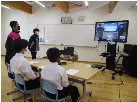
＜宇久中学校校とのリモート学習会＞