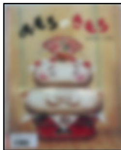
かがみもちが にげだした！？