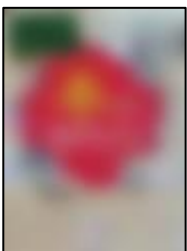
本が好きになる さやましようこ・漫画 /旺文社

文化庁が9月に「国語に関する世論調査」の結果を発表しました。その調査によると、1か月に本を1冊も読まない人が6・6%もいるそうです。10人のうち、6人はまったく本を読まないといふことになります。 本を読む時間が減た理由には、メディアに触れる時間が長なったこと、があると思ひます。この秋は、ネットやゲームの時間を半分にして、家族みんなで読書をする時間を作ってみませんか?