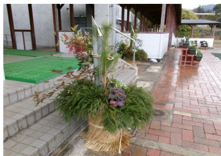
今年も世知原地区健全育成会の皆様に門松を飾っていただきました。