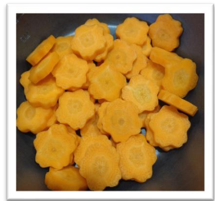
4月に入れたかざりにんじん

全員に行きわたるのは、難しいかとは思いますが、ご家庭での話題にしていただけたらと思います。