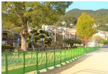
児童の安全を守ります

次も写真をご覧ください。運動場の一角をフェンスで仕切っています。運動場の周囲のブロック塀の補修工事と校庭奥の石垣の擁壁工事が始まります。