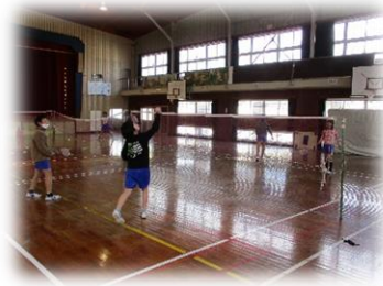
卓球・バドミントン