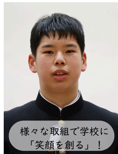
様々な取組で学校に 「笑顔を創る」！

今年の生徒会のスローガンは「笑顔を創る」です。対話や楽しみを通じて、自然と笑顔が生まれる学校を皆さんと共に創りたいと思います。私自身、感情のコントロールや協力を仰ぐことが苦手な面もありますが、自分の課題と向き合い、一步ずつ成長していきます。全員が主役の生徒会です。アンケートなどで皆さんの声を大切に聞き、より良い宇久中を目指します。一年間、どうぞよろしくお願いします。