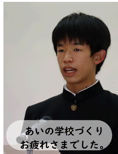
あいの学校づくり お疲れさまでした。

今日からは新体制がスタートします。「笑顔を創る」という新会長の熱い理想のもと、宇久中がさらに輝くことを期待しています。皆さん、本当にありがとうございました。