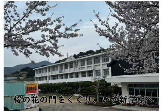
桜の花の門をくぐり、いざ新学期へ

このところ暖かい日と寒い日が3～4日ごとに交互に続いています。まさに「三寒四温！」徐々に春を感じられる日が増えてきました。宇久中学校の校門の3本の桜の樹も、3月末に花を咲かせ始めたかと思えば、もうすっかり満開です。いよいよ今日から令和8年度の宇久中学校も始まります。1学期始業式の様子と今年度から転入した職員の紹介をします。