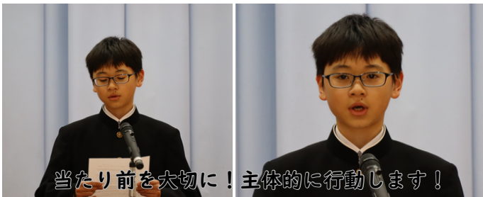
当たり前を大切に！主体的に行動します！

はじめに、代表の新2年生の生徒が、昨年度1年間の成長と反省を踏まえて、次のように1学期の抱負を述べました。