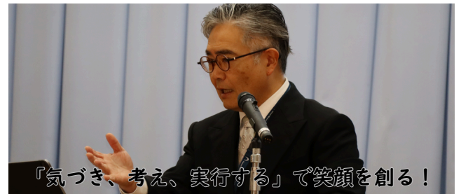
「気づき、考え、実行する」で笑顔を創る！

次に、校長先生から、令和8年度1学期の目標「気づき、考え、実行する！」について話がありました。以下はその内容です。